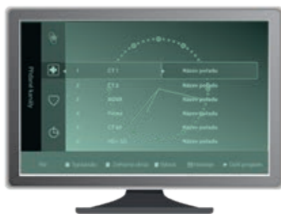
Ukázka řazení programů od výrobce TV přijímače Samsung