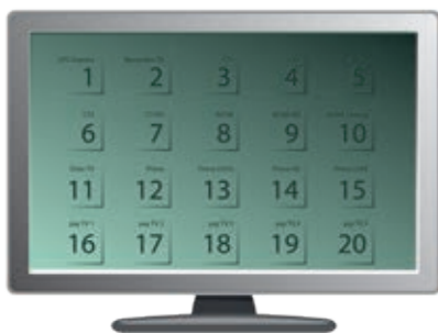
Ukázka řazení programů od výrobce TV přijímače Philips

Po úvodním 10denním období budou dostupné programy podle smluvně sjednané programové nabídky. Podle softwaru TV přijímače je řazení programů dáno výrobcem TV přijímače.